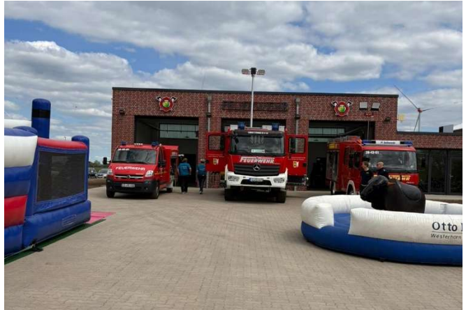
die Fahrzeuge, Halle und Räumlichkeiten wurden vorgestellt