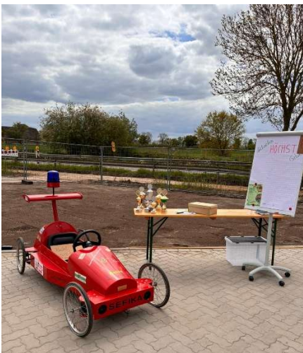
diese Seifenkiste wurde verkauft