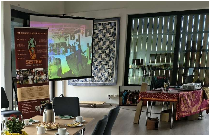
Sister Hilfe Fotos