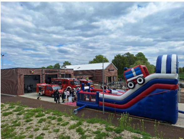
Ausblick vom Hügel auf die große Hüpfburg und Feuerwehr