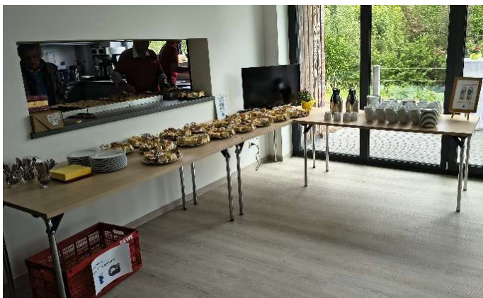
Kaffee und Kuchen vom DRK

Die Seifenkiste der Feuerwehr wurde an einen Sommerländer mit dem höchsten Gebot verkauft. Vielleicht fährt sie demnächst durch die Gemeinde?