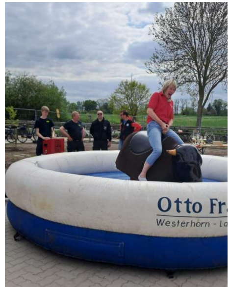
viel Spaß beim Bullenreiten

Am Abend stärkten sich die Gäste mit Pommes und verschiedenen Burger beim „Burger Meister“.