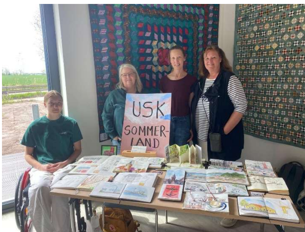
Skizzen von den Urban Sketchers