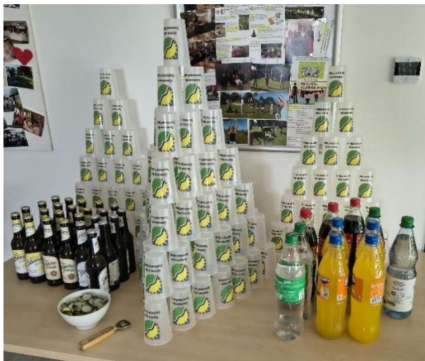
Softgetränke und Bier