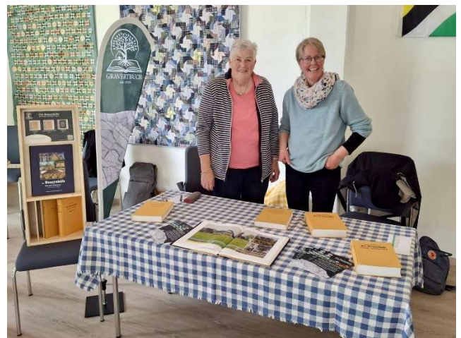
ein Stand mit dem guten alten „Gravert Buch“