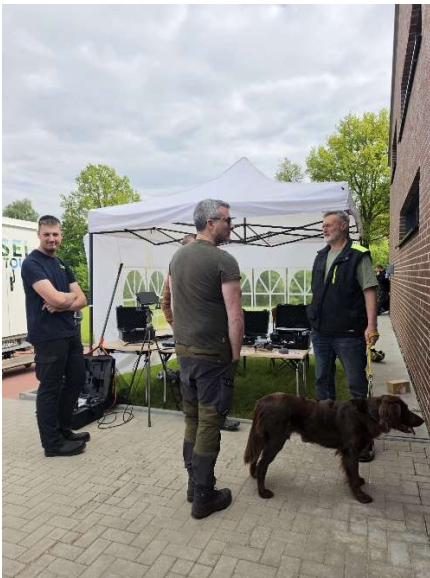
Stand vom Verein für Rehkitzrettung