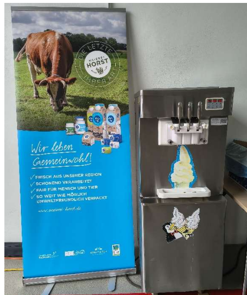
die Softeismaschine mit Schoko und Vanille